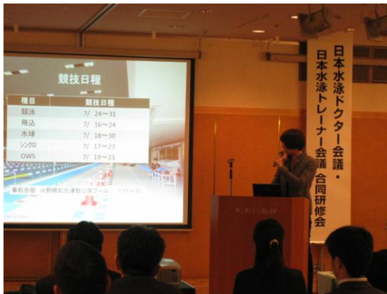
(写真1：元島先生による帯同報告)