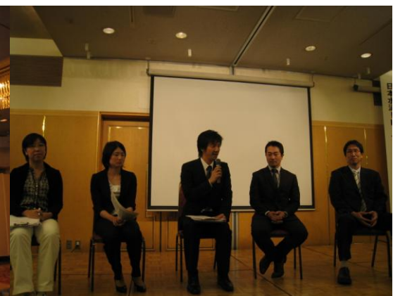
(写真3, 4：シンポジウム風景)